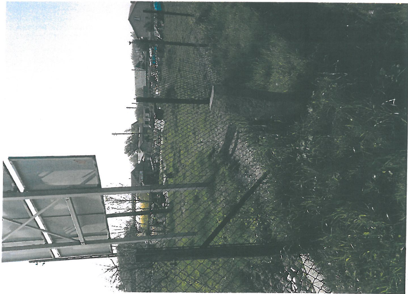
for. Skład opału