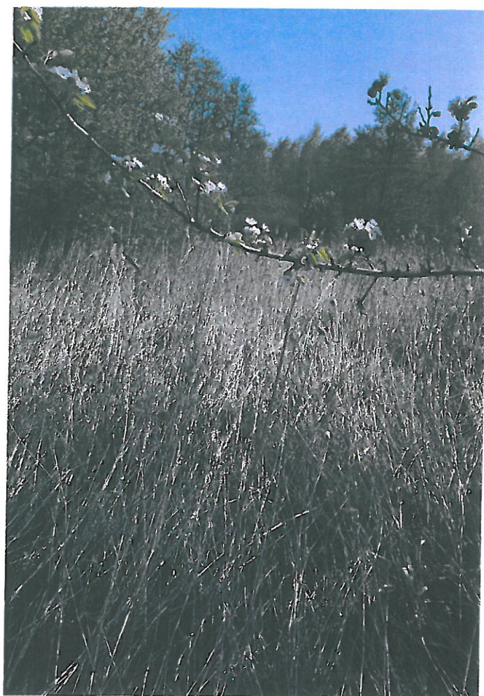
fol. Tereny niezabudowane (enklawy wśród zabudowy)