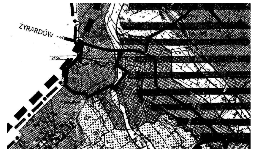
WYRYS Z RYSUNKU STUDIUM UWARUNKOWAŃ I KIERUNKÓW ZAGOSPODAROWANIA PRZESTRZENNEGO GMINY JAKTORÓW